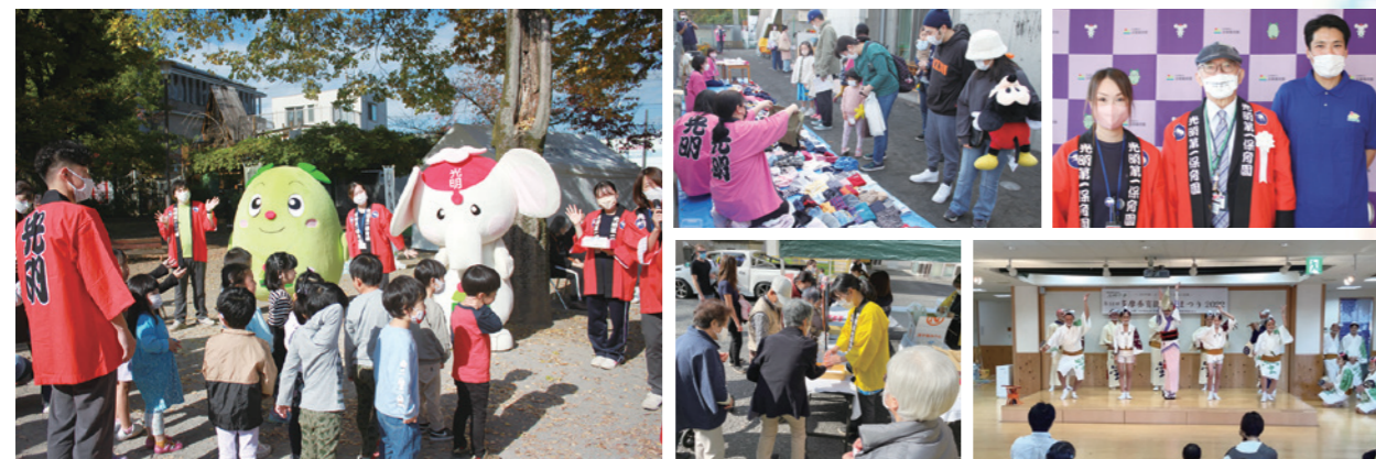
多摩養育園福祉大使やゲストのみなさんが各拠点で出演、会場は大盛り上がり

11月12日、秋晴れの中、各拠点、それぞれがバラエティーに富んだ内容で開催。後援会、保護者会、地域ボランティアの方々等、多岐にわたる温かなご支援、ご協力をいただき総勢約1,500人が参加！コロナ禍ではありましたが、無事に開催することができました。また来年も皆様と共に、開催できることを楽しみにしております。